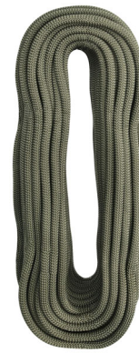
STATIC R44 10.5 L0430