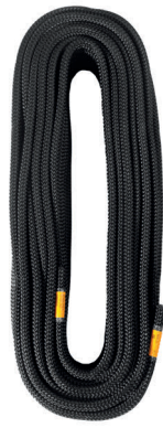
STATIC 10.5 L0230