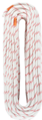
STATIC 9.0 L0220