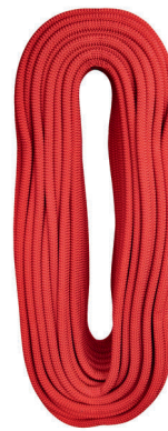
STATIC 11.0 L0250